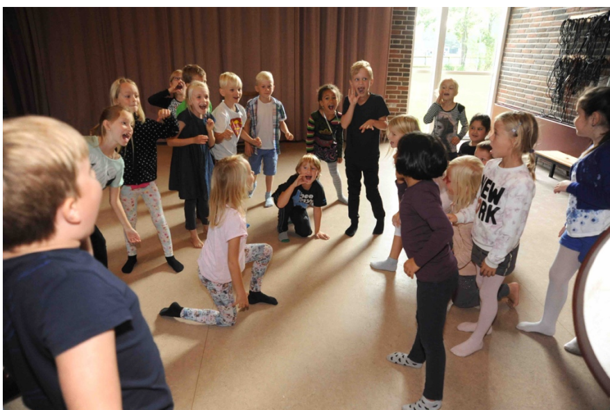
Første klasse fra Agedrup skole kalder på naboen: "Skal vi lege?".

De største elever kan nu sætte det hele sammen, således at de laver skulptur 1, fryser og siger 1. sætning. Så laver de skulptur 2, fryser og siger 2. sætning. Så laver de skulptur 3, fryser og siger 3. sætning. Og så gentager de sekvensen og ender i et langt frys. Koreografierne kan vises til en anden klasse eller på et forældremøde. Kan også optages på korte videoer.