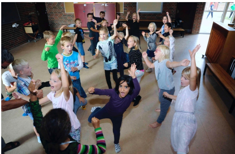
Første klasse laver en ny skulptur, hver gang trommen slår på ny.

Du stiller klassen op i en rundkreds. Hver gang du trommer eller slår på en klokke, er det den næstes tur i kredsen til at sige sine 3 sætninger.