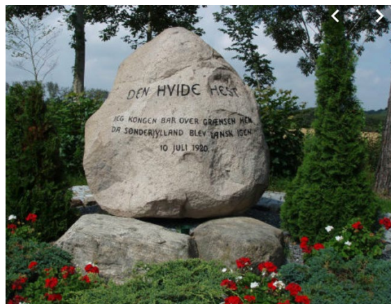
Den hvide hest's hov, der blev forsølvet og sendt til kongen, som brugte den som askebæger. Samt hestens gravsten.